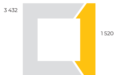
Гендерна структура, осіб