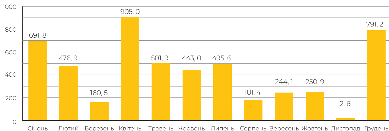
Економічний ефект від впровадження пропозицій у 2018 році (тис. грн)

Загальний економічний ефект від впровадження пропозицій у 2018 році склав 5 144,7 тис. грн.