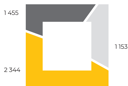
Вікова структура, осіб