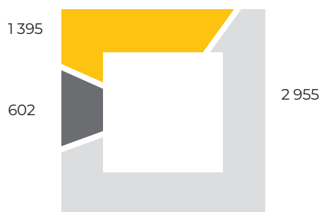
Категорії персоналу, осіб