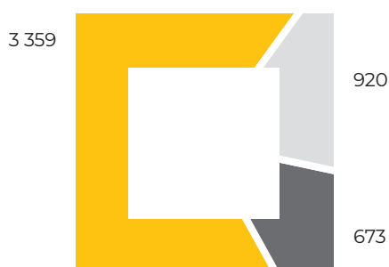
Чисельність персоналу, осіб

Станом на 31 грудня 2018 року у структурних підрозділах компанії працювали 4 952 особи. Середньоспискова чисельність співробітників компанії у 2018 році склала 5 025 осіб. У звітному році було прийнято на роботу 692 працівники, звільнилися 930 співробітників. Плинність кадрів склала 5,43%. Переважна більшість персоналу – 4 082 особи – мають вищу освіту за різними рівнями акредитації.